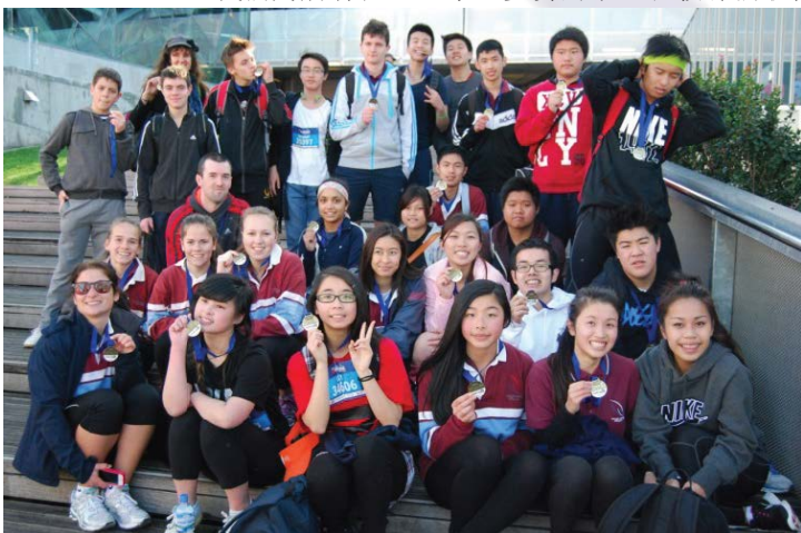
参加 2013 年度“奔跑吧，墨尔本”活动的学生和教职员

我们为所有在这一年里参赛的学生和教练们取得成绩和付出的努力表示祝贺并为此感到骄傲！